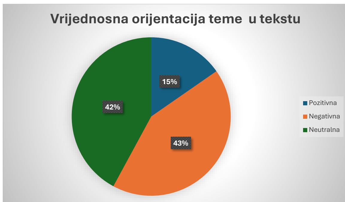
Slika 3. Zastupljenost različitih vrijednosnih orijentacija teme u tekstu.