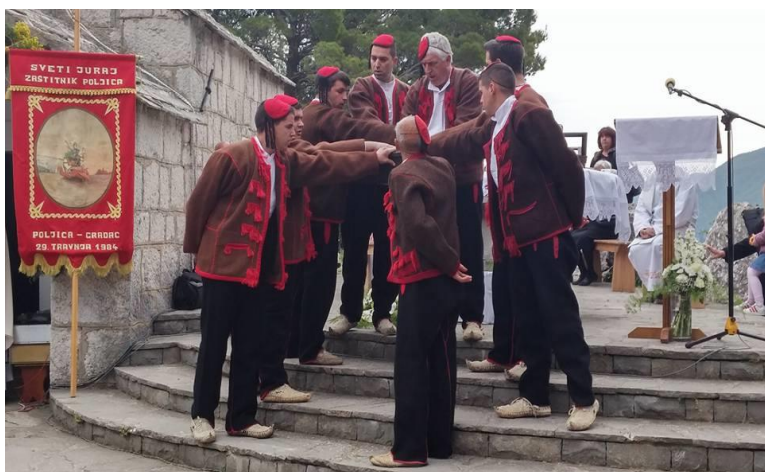
Slika 2. Prikaz biranja velikog kneza 31

Najvažniji dokument koji svjedoči o organizaciji i imovinsko-pravnim odnosima Poljica je Poljički statut, koji je napisan 1440. godine. Pisan je poljičkom bosančicom u crkvi sv. Klementa u kantunu Sitno. 30 Statut je služio kao temeljni pravni dokument koji je regulirao prava i obveze stanovnika poljičkog kraja, uključujući pitanja nasljeđivanja, vlasništva, kaznenih djela i kazni. Poljička kneževina bila je podijeljena prema statutu na tri kantuna, svaki kantun imao je svog malog kneza, dok je veliki knez bio na čelu cijele kneževine. Mandat velikog kneza trajao je jednu godinu te bi se biranje održavalo svake godine 22. travnja na blagdan sv. Jure.