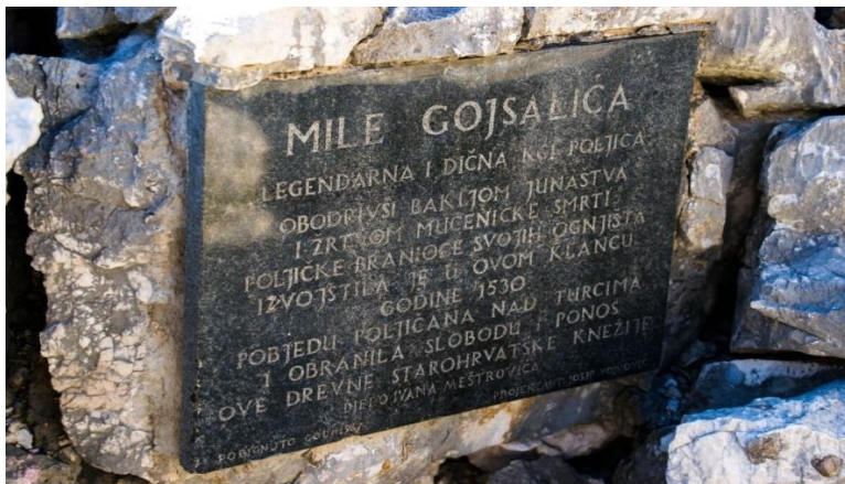
Slika 4. Natpis na Meštrovićevom kipu 46

spasi narod od zatornika.“ 42 , potom Drago Ivanišević u Stihovima o Mili Gojsalić piše ... u ruhu svečanu smrću praćena, s vatrom u srcu i u rukama dođe do osmanskog tabora pod Gracem. ... 43 . Njezin spomenik, djelo Ivana Meštrovića, postavljen je na litici iznad Omiša, gledajući prema Cetini i Poljicima, kao trajni podsjetnik na njezinu hrabrost. 44 Inicijativa za postavljanje kipa Mile Gojsalić pokrenulo je Društvo Poljičana, koji su pisali hrvatskom umjetniku Ivanu Meštroviću koji je u to vrijeme djelovao u Australiji, Meštrović je odmah prihvatio ideju s obzirom na to da se vrlo rado dičio svojim korijenima i nacionalnim motivima, kip je odljeven u Zagrebu, a za 160 godina gubitka samostalnosti Poljičke Kneževine otkriven je 19. kolovoza 1967. pod Gracem u blizini mjesta Gata. 45 Svake godine u Poljicima i Omišu održavaju se manifestacije i sjećanja u čast Mile Gojsalić, a njezina priča prenosi se s generacije na generaciju, održavajući živom uspomenu na ovu izuzetnu junakinju.