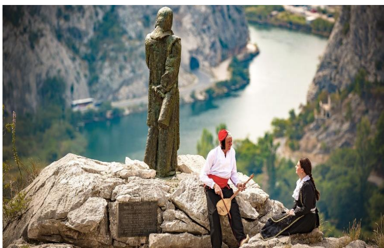
Slika 3. Meštrovićev kip Mile Gojsalić 38

Mila Gojsalić poznata kao “hrvatska Judita” jedna je od heroína u hrvatskoj povijesti. U literaturi uglavnom nailazimo Milu pod nazivom Mila 35 , međutim u Poljicima uglavnom ženska imena završavaju na samoglasnikom -e 36 pa ću stoga u ovom radu očuvati izvornost imena. Mile je rođena u malom selu Kostanje u Poljicima početkom 16. stoljeća, što navode i autori Kuvačić i Mihanović u svojim knjigama. 37 U Kostanjima i danas žive Gojsalići i gdje je sačuvana kuća u kojoj je možda bila rođena i iz koje je otišla u osmanski čador da joj otmu tjelesnu nevinost. Podatke o Milinom životu pronalazimo u povijesnim izvorima, legendama i usmenoj predaji.