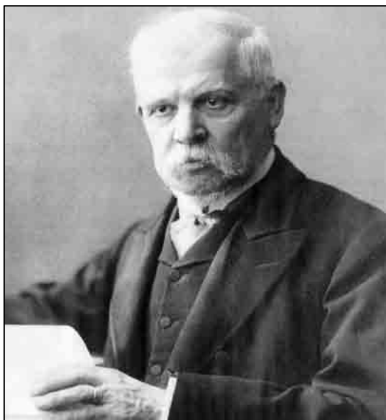
Sl. 2. Vatroslav Jagić

Za našu liturgiju bit će još dosta vremena i prilike, da vas interesujem. Za sada se, žalibože, ne može ništa odlučnijega učiniti. Što bi pako meni, za bolje poznavanje te stvari moglo biti od koristi ili potrebe, molim Vas, da me na to i nadalje prijateljski izvolite upozorivati, i koliko Vam je vremena i prilike, nabavljati mi i pošiljati izvornike i pomagala, kakovih si sam ne znam ni ne mogu nabavljati, naročito iz Senjskoga kuta.