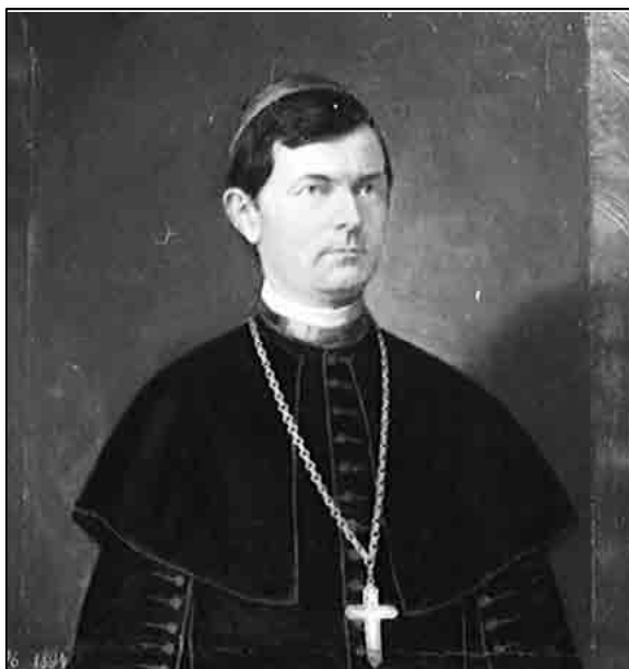
Sl. 1. Juraj Posilović

objelodanjeni itd. U pismima navodi i neke pojedinosti iz svog privatnoga života, npr. liječenje u toplicama. Iz tih se pisama razabire da je senjski biskup Juraj Posilović s Vatroslavom Jagićem uspostavio prijateljske odnose. To se razabire iz oslovljavanja; Posilović će Jagića osloviti: Visokorodni gospodine (3), Presvietli gospodine (6), Visokocienjeni prijatelju (2), Dragi prijatelju (1). Sebe će pak, uz izraze poštovanja i pozdrav, potpisati kao: pokorni Juraj Posilović (1), pokorni sluga Juraj Posilović (3), ponizni sluga i prijatelj (1), Vaš najodaniji prijatelj (1), ponizni sluga (2), ponizni prijatelj (1).