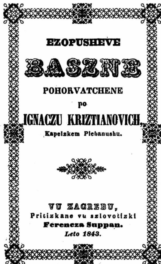
Naslovnica Ezopovih basana u Kristijanovićeovom izdanju (1843.).