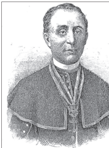
Franjo Rački (1828–1894)