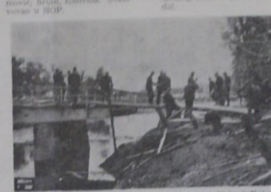
Most preko Vuka kod veslačkog kluba popravljaju jedinice naše armije nakon ulaska u Vukovar