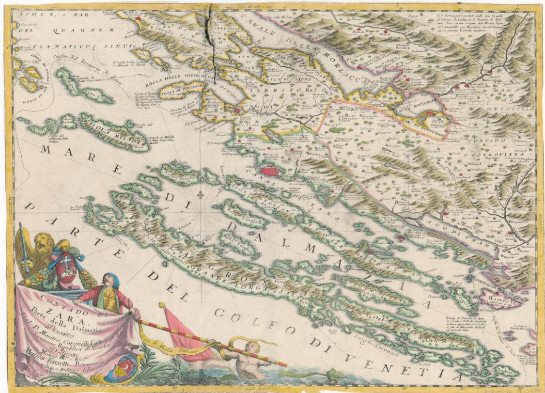
Karta 4. Vincenzo Maria Coronelli, Karta Jadranskog mora, XVI. st.