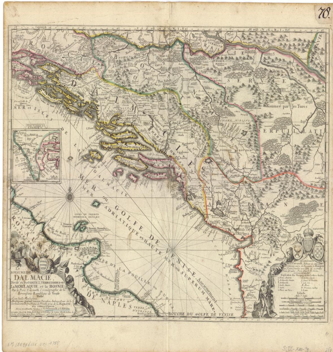
Karta 3. Vincenzo Maria Coronelli, Karta Jadranskog mora, XVI. st.