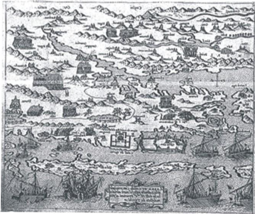
Karta 2. Isole famose, porti, fortezze e terre maritime sottoposte alla Serenissima Signoria di Venezia, ad altri principi christiani et al Signor Turco nuovamente poste in luce, iz 1574. godine (Giovani Francesco Camoci). Lit. Pet stoljeća geografskih i pomorskih karata Hrvatske, Zagreb 2005., str. 298